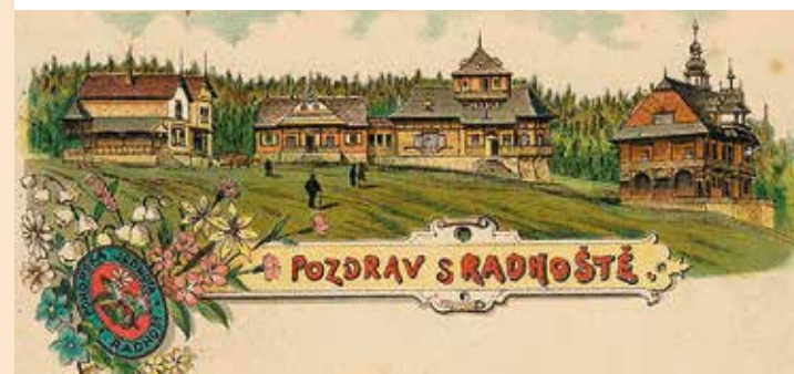
Pozdrav z Radhoště - dobová pohlednice

V zimním období se jeskyně stává útočištěm pro řadu druhů netopýrů. Mezi vzácnější a převažující druhy patří netopýr velký a vrápenec malý, kteří patří mezi kriticky ohrožené druhy. Tyto jeskyně jsou ideálním zimovištěm netopýrů i díky minimálnímu vyrušování člověkem. Důvodem navrhované ochrany lokality je zachování jedinečného geologického a geomorfologického fenoménu a přítomnost úkrytů netopýrů. V roce 2013 zde navíc byl nalezen poddruh mrvatky, dvoukřídlého hmyzu, který představuje první nález po České republice.