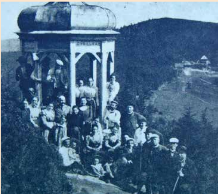
▼ Pustevny ▲