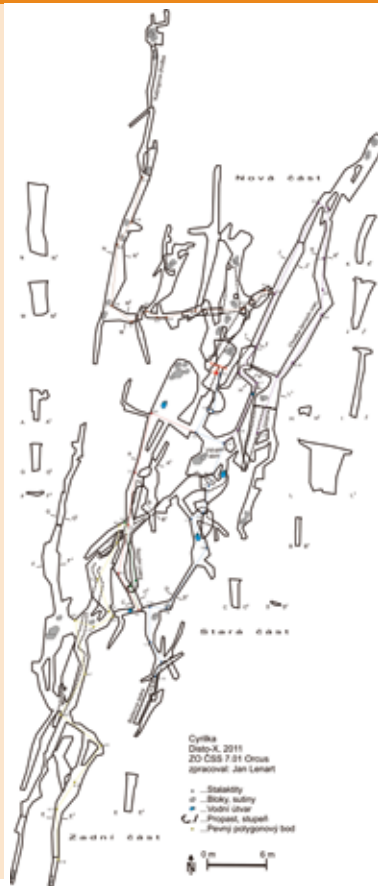
Zákres jeskyně Cyrilka