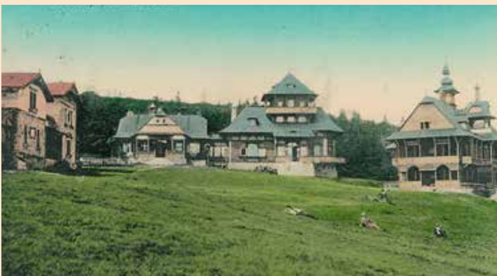
Pustevny pod Radhoštěm - dobová fotografie

sedmikvítek evropský. Z velkých šelem lze v Beskydech zahlédnout medvěda hnědého i rysa ostrovida.