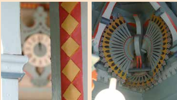
interiér chaty Libušín před požárem (arch. Dušan Jurkovič)

po sobě klouzaly a za přispění dalších procesů vznikly systémy rozevřených puklin. Nejedná se tedy o klasické krasové jeskyně, krápníkovou výzdobu zde nenajdete.